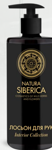
ЛОСЬОН ДЛЯ РУК