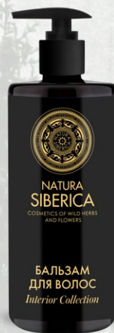
БАЛЬЗАМ ДЛЯ ВОЛОС