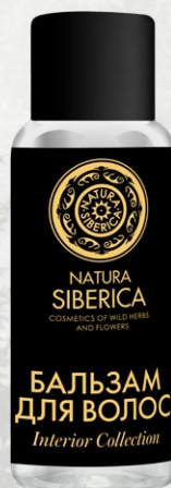
БАЛЬЗАМ для ВОЛОС