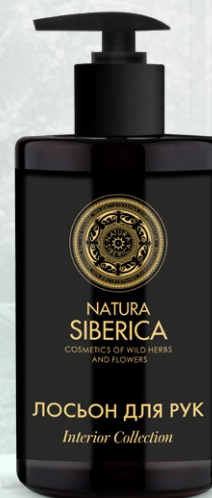
ЛОСЬОН ДЛЯ РУК