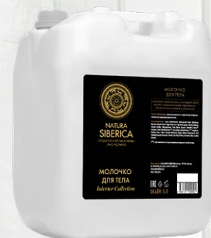
МОЛОЧКО ДЛЯ ТЕЛА