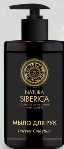
МЫЛО ДЛЯ РУК