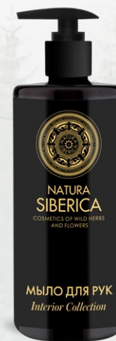
МЫЛО ДЛЯ РУК