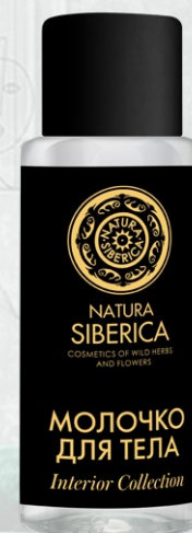
МОЛОЧКО для ТЕЛА