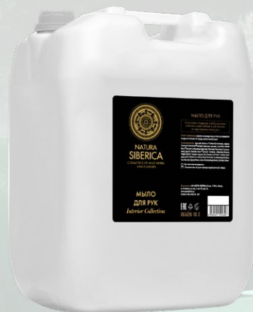
МЫЛО ДЛЯ РУК