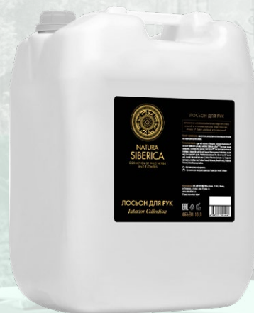
ЛОСЬОН ДЛЯ РУК