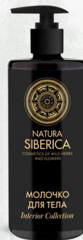
МОЛОЧКО ДЛЯ ТЕЛА