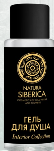
ГЕЛЬ для ДУША