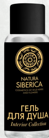
ГЕЛЬ для ДУША