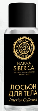
ЛОСЬОН для ТЕЛА