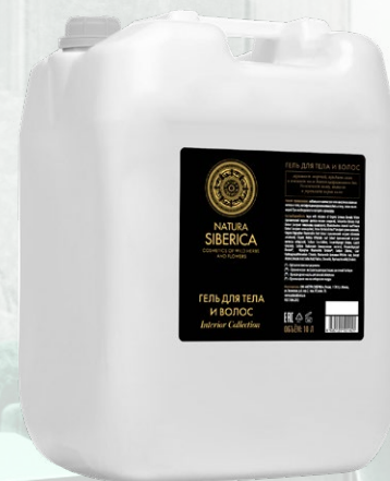
ГЕЛЬ ДЛЯ ТЕЛА И ВОЛОС