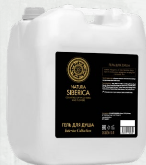
ГЕЛЬ ДЛЯ ДУША