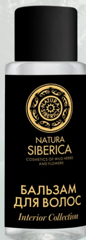
БАЛЬЗАМ для ВОЛОС