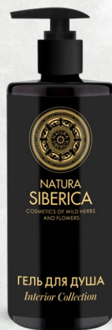
ГЕЛЬ ДЛЯ ДУША