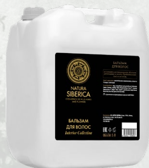
БАЛЬЗАМ ДЛЯ ВОЛОС